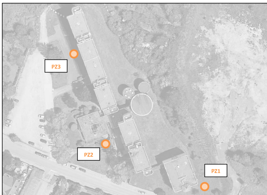
Implantation des piézomètres